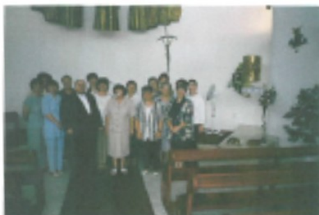
23.5.2001, Michalovce – Močarany