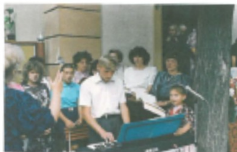
15. august 1991, Medzev-Grunt

O rok neskôr v auguste 1991 sme spievali na odpustovej slávnosti v kaplnke Nanobovzatia Panny Márie v Nižnom Medzeve – Grunt.