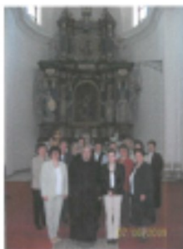
2009 - Súčasnosť