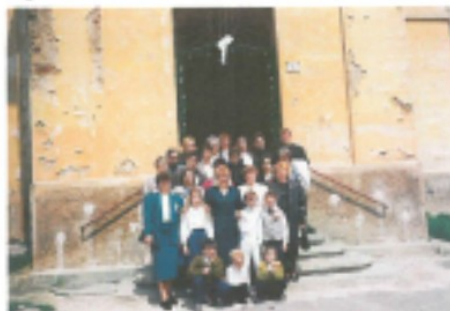
30. apríl 1995, birmovka, Vyšný Medzev