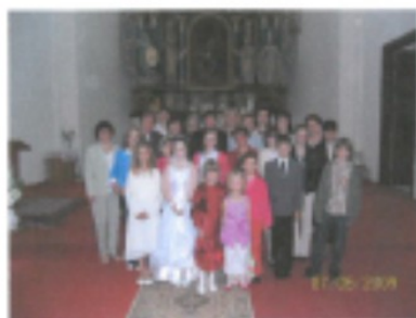
7. jún 2009 - Prvé sväté prijímanie

Je veľmi dôležité, aby človek vedel, čo spieva a prečo spieva. Aké vznešené, užitočné a liečivé cvičenie je, keď sa duchovné piesne spievajú s vážnosťou a pobožnosťou, čisto a veľa.