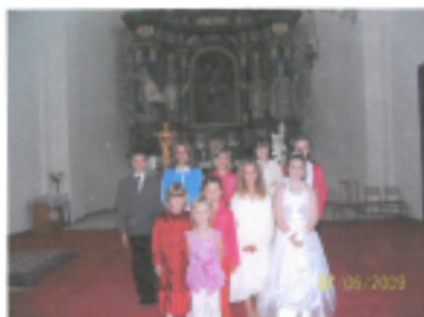
7. jún 2009, Naša budúcnosť