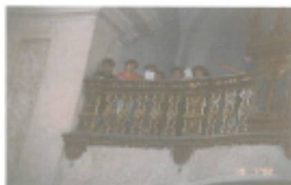
19. júl 1992, Vyšný Medzev

Odpustové slávnosti v kostole Sv. Márie Magdalény vo Vyšnom Medzeve, v našom domovskom svätostánku, patria medzi naše najobľúbenejšie a najočakávanejšie v celom cirkevnom roku. Tu určite platí, že kto spieva, dvakrát sa modlí.